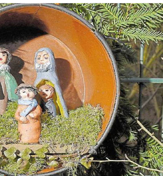
auf Moos und Zweigen kunstvoll arrangiert.