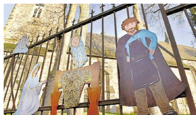
Am Gitter der Kirche St. Viktor hängen große Krippenfiguren, die von Teilnehmern der Kreativwerkstatt Kunst mal anders gefertigt wurden.