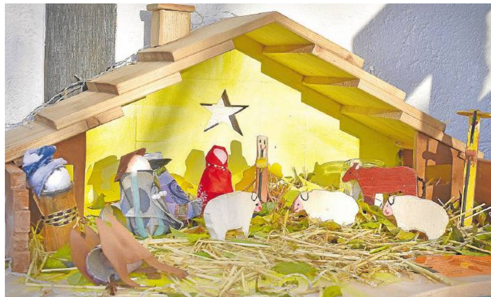
In der Krippe des Kindergartens BeSiLa stehen 15 hölzerne Figuren, die mit Buntlack verziert wurden.